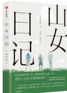
《山女日记》 [日]凑佳苗著 高扬蒋露译 中信出版集团 (2017年6月版)

热播剧《我的前半生》讲的是两个女人各自不同的命运——离婚的罗子君,从原来的温室宝宝破茧成蝶;而叱咤风云的唐晶,却因为对未来的恐惧和对真正独立的自信失去了唾手可得幸福。有人分析,这部剧之所以大火,是因为它“透支了所有女人对于生活的安全感”。