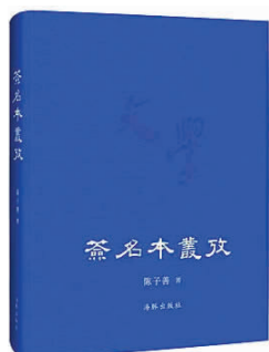
《签名本丛考》 陈子善著 海豚出版社 (2017年5月版)