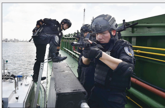
▲水面空中突击队队员身着潜水装备,在黄浦江上开展训练,模拟实战,加强水中反恐作战能力。