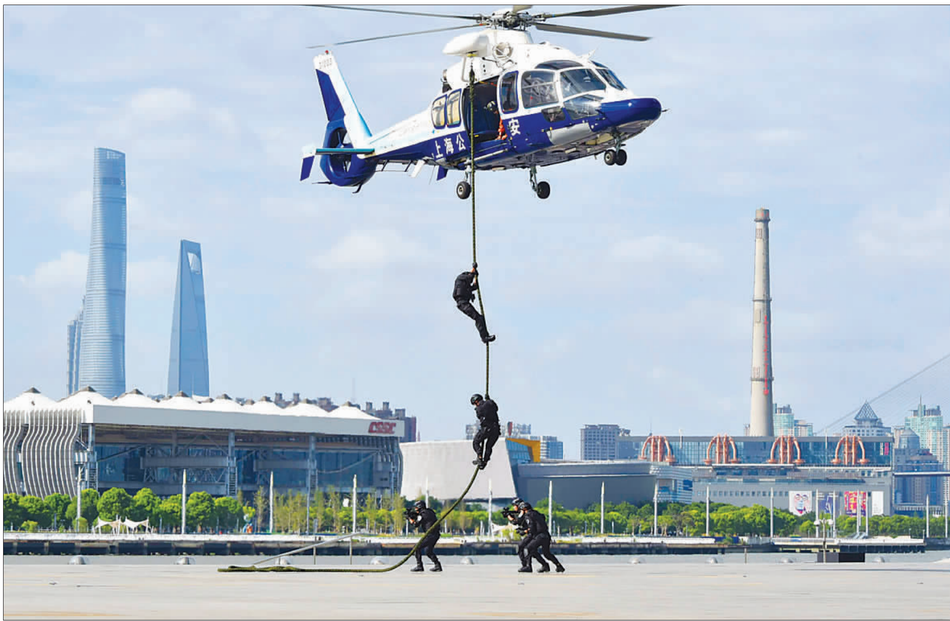
▲直升机旋翼轰鸣声中,特警突击队员与警务航空队紧密协作,联训、联勤、联动,时刻准备从空中为反恐处突提供支援。