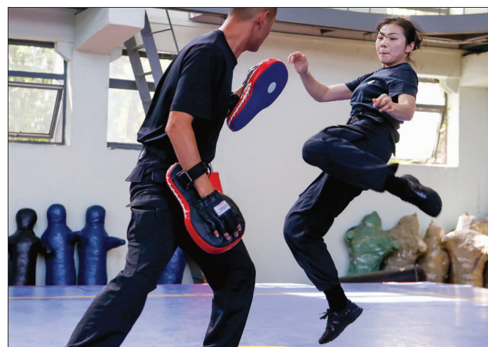
▲巾帼不让须眉,“90后”女特警与男特警混编互搏,有效提高实战搏击能力。