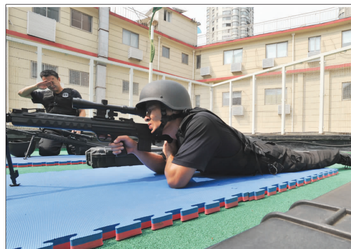
▲特警队狙击手每天训练瞄准,一趴就是两个小时,眼睛经常酸痛到睁不开。