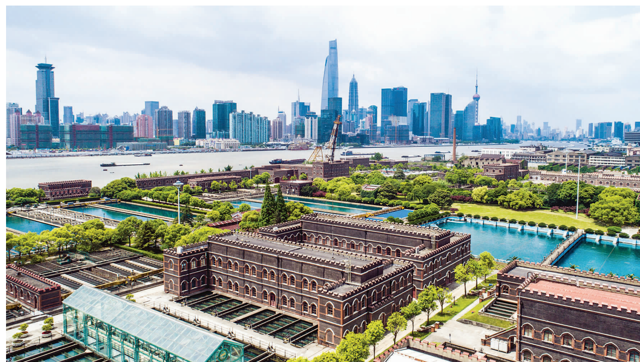
空中俯瞰上海百年水厂杨树浦水厂全景。

连接浦西和浦东的轮渡线有着老杨浦最“亲水”的记忆:做工的人往来两岸讨生活,小孩乘船去浦东洋泾一带摸鱼摸虾,轮渡如果遇到大型船只,会在江心停一停,等大船先过。