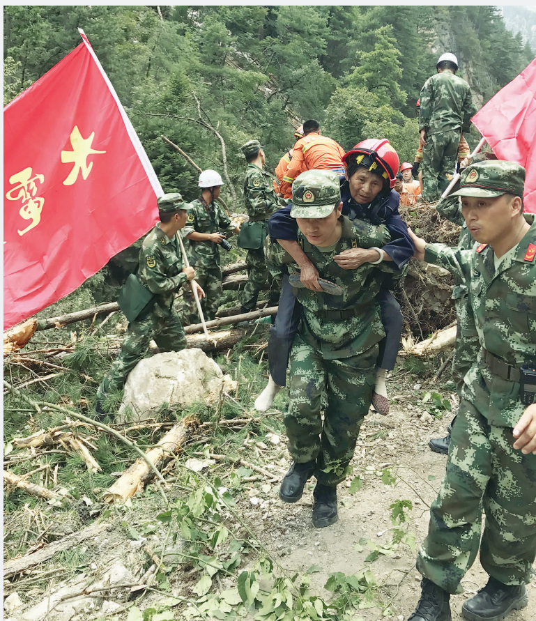
8月9日,武警水电救援人员在九寨沟地震灾区转移受灾群众。

截至9日18时25分,经初步核查,九寨沟地震已致19人死亡,263人受伤。伤者中,10人重伤(危重3人),253人轻伤