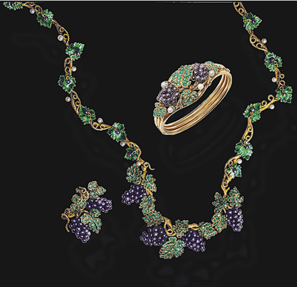
左图为清代镶珠宝钿子，右图为制作于约1850年的法国宫廷葡萄串全套首饰（本版图片均为资料图片）

发间腕底，浸润着各自独特历史文化的东西方佩戴艺术，呈现出不一样的珠光翠影，却同样在历史长河中留下璀璨的印记。值得珍视的，不仅有人对于美亘古不变的追求，更有手艺人用匠心雕刻的卓越技艺。