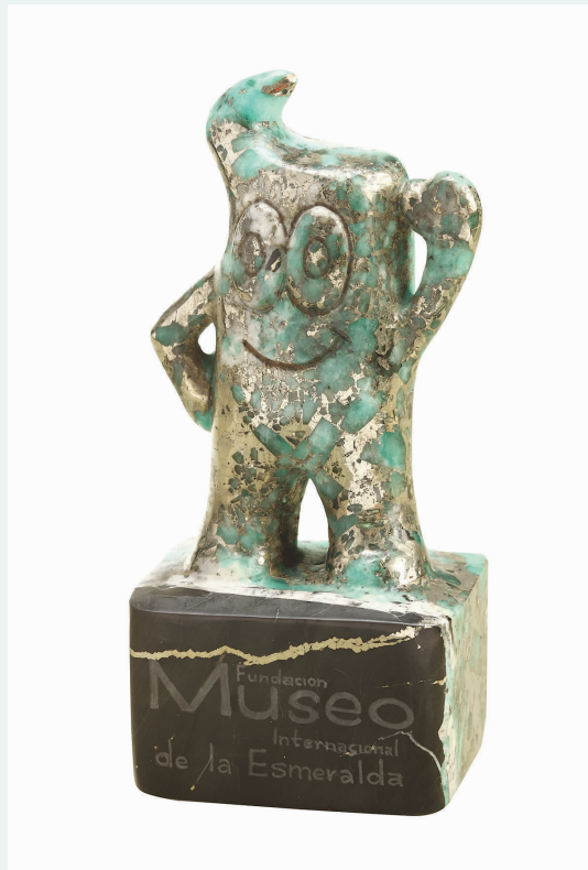
哥伦比亚祖母绿海宝，由上海世博会哥伦比亚馆捐赠。祖母绿宝石不仅是哥伦比亚的国石，更是哥伦比亚人的象征和骄傲。这是2010年，哥伦比亚参展方专门为上海世博会打造的祖母绿海宝，5000克拉，为哥伦比亚馆的镇馆之宝。