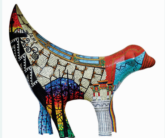
香蕉羊，由英国利物浦市政厅捐赠。在英国利物浦，日本艺术家太郎千惠藏1998年创作的超级香蕉羊是极受欢迎的公共艺术雕塑。它由混凝土和钢筋组成，造型独特。这个不寻常的作品代表了利物浦市一直以来在出口羔羊及香蕉进口贸易上的悠久历史。