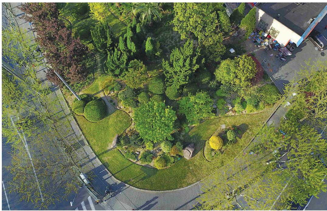
东明路齐河路交叉口街心花园是一处花境试验点,200平方米空间种植了上百种植物,好似一个大盆景。

杂花生树,千针万线,编织有序。在植物搭配方面,团队首先选择适宜浦东盐碱土质生长的抗旱、抗瘠薄、株型紧密、根系发达、颜色与岩石相协调的岩石植物品种,构成一幅连续、有变化的风景序列构图:大岩石边、岩石间,种植小乔木,如梅花、红千层;下层植物星星点点散落生长在细碎的石子间隙,以百合科、景天科等宿根花卉并满其间,品种有荷兰菊、天人菊。为了增强秋冬季景色,点缀了观果、观叶植物及小叶常