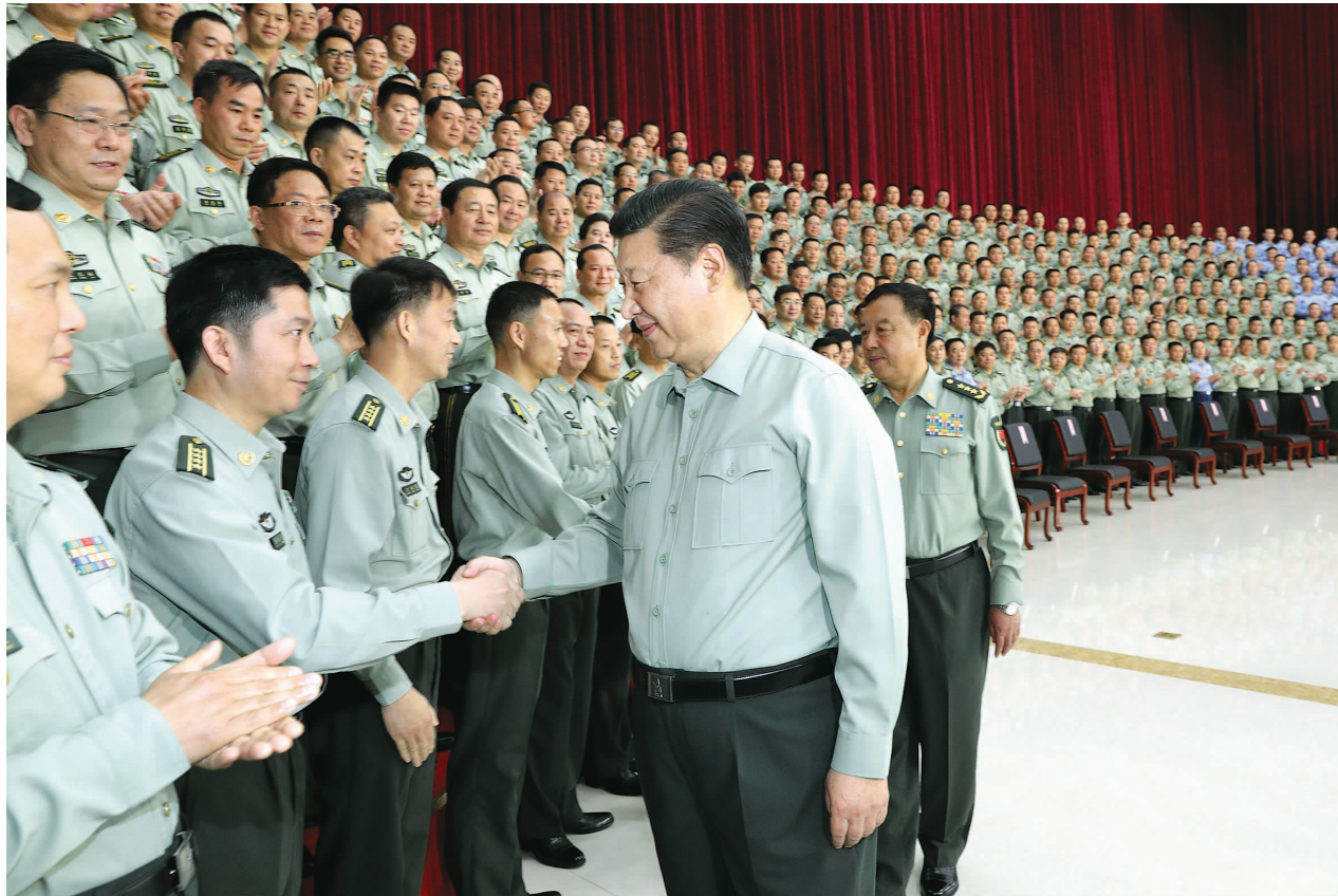
习近平亲切接见驻广西部队以上领导干部、驻南宁部队团级单位主官和南部战区陆军机关正团职干部。