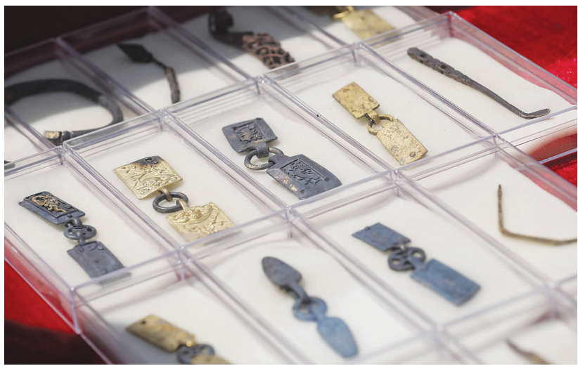
发掘出的金银饰品。

本次出水文物数量之多、等级之高，涉及种类之丰富，时代跨度之大，地域之广，堪称一项非常重大的考古成果。出水的文物种类以金银铜铁等金属材质的