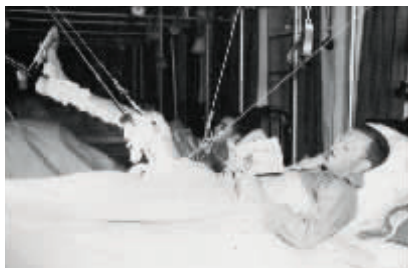
军供版图书与正在阅读的伤员

会的阅读小组把那些触犯美国联邦、与美国的民主精神相冲突、触犯宗教、触犯种族、触犯商业以及违反专业知识的段落标识出来。这些虽被随心所欲地解释,但确实起到了防止某些图书出版的作用。