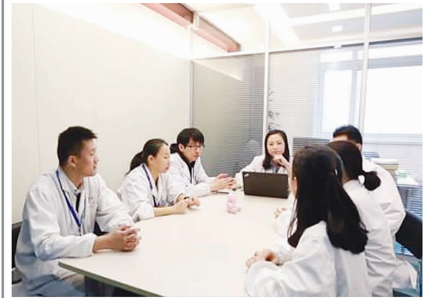
“红讲台”的青年医务人员用业余时间讨论怎么给孩子们上青春期教育课。