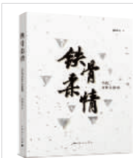
《铁骨柔情》 楼乘震著 上海人民出版社出版

回到分社，我翻阅《随想录》，我边哭边读着用血泪写成的文字。那天是周末，接到一个电话，说巴老即将出访法国，问我还有什么问题，他愿意再给我留出一些时间。我回答说不用了，因为材料足够。懵懂的我，竟然错过了再一次倾听巴老讲话的大好机会。之后，我写的通讯标题借用了巴老自己的话：一颗燃烧的心。这是我，一个读者、一个年轻记者有幸坐在巴老的身边，面对这位忘却自己的伤痛而期望国家强盛、为此捧出真诚的心的作家，所真正体味到的。