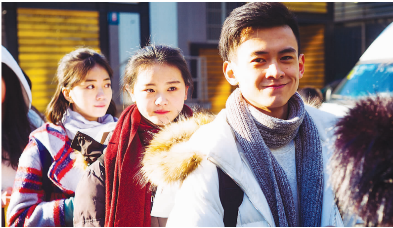
节后,中戏、北电、上戏三大知名艺术院校先后开考。今年报考依然火爆,报考人次创新高。图为上戏考生在寒风中候场。

人的,它给考生戴了一个‘假面具’,把表演套路化。可表演入门阶段恰恰是需要打开自己,释放情感的过程。”不过,随着二试、三试中即兴表演等项目的加入,“假面具”也会随之逐步摘掉——真正脱颖而出的还是具有表演天赋和感知力,拥有一定文化积累的考生。