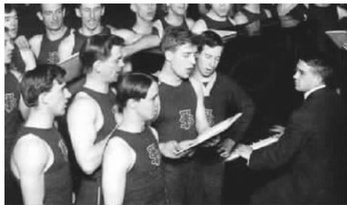
唱赞美诗的运动员，1909年摄于美国麻省基督教青年会训练学校体育馆。

在美式橄榄球，尤其是大学橄榄球运动的世界中，与之类似、剑拔弩张的世仇对决比比皆是，甚至成为了比赛的最大卖点之一，吸引全州、全国的目光。例如得克萨斯大学与俄克拉荷马大学之间的橄榄球对抗就被叫做“红河枪战”(Red River Showdown)，起因是1931年得克萨斯州与俄克拉荷马州的国民警卫队曾为一座横跨两州界红河上大桥的归属权问题爆发枪战。而密歇根大学与俄亥俄大学之间的恩怨则可以追溯到1835年时两州围绕边境划分问题酿成的冲突。自1897年后，两校代表两州在橄榄球场上的厮杀成为北美体育史上最精彩、最激烈乃至最悲