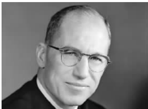
20世纪美国最高法院史上最重要的大法官之一拜伦·怀特(Byron White)曾是其母校科罗拉多州立大学橄榄球队的绝对主力和当家球星。