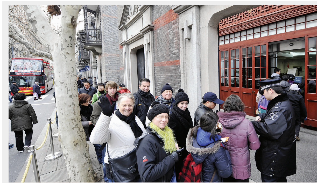
前来中共一大会议址参观的游客在门前排起长队。