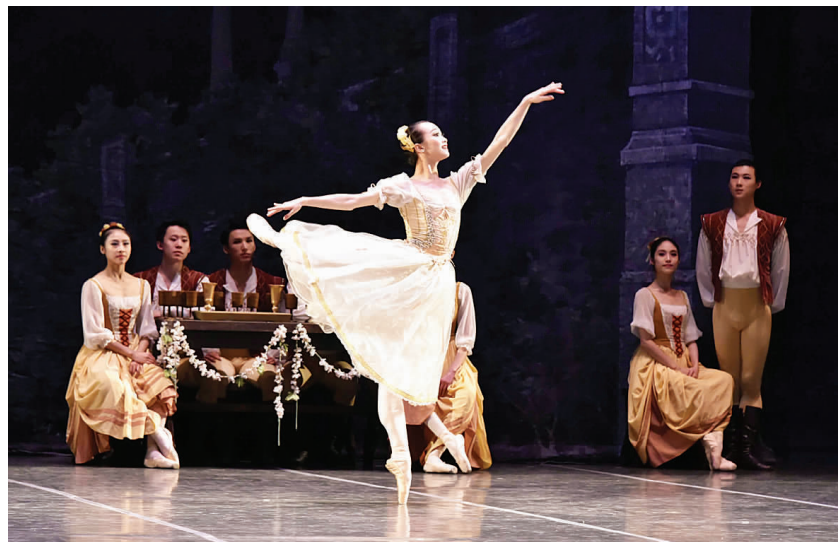
上海芭蕾舞团演员在演出芭蕾舞剧《天鹅湖》。