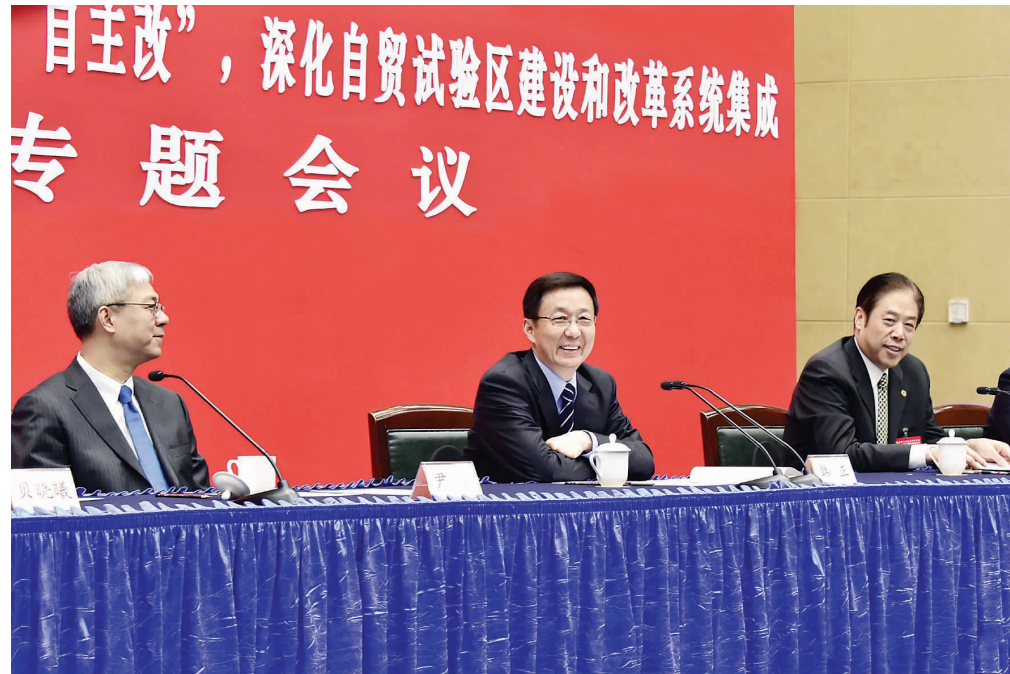
韩正参加政协专题会议。

形成制度创新的高地,而不是优惠政策的洼地,优惠政策不可复制、不可推广,不是我们探索的方向。下一步要不断强化制度创新改革的系统集成,这比单项改革举措要求更高、难度更大。要牢牢把握上海自贸试验区是苗圃、不是盆景,不求一地试验成功,而要把创新制度成果在更大范围内复制和推广,在率先探索开放经济新体制方面不断取得新突破。 韩正强调,要有自我革新的胸怀,始终紧盯政府自身的改革。自贸区改革是