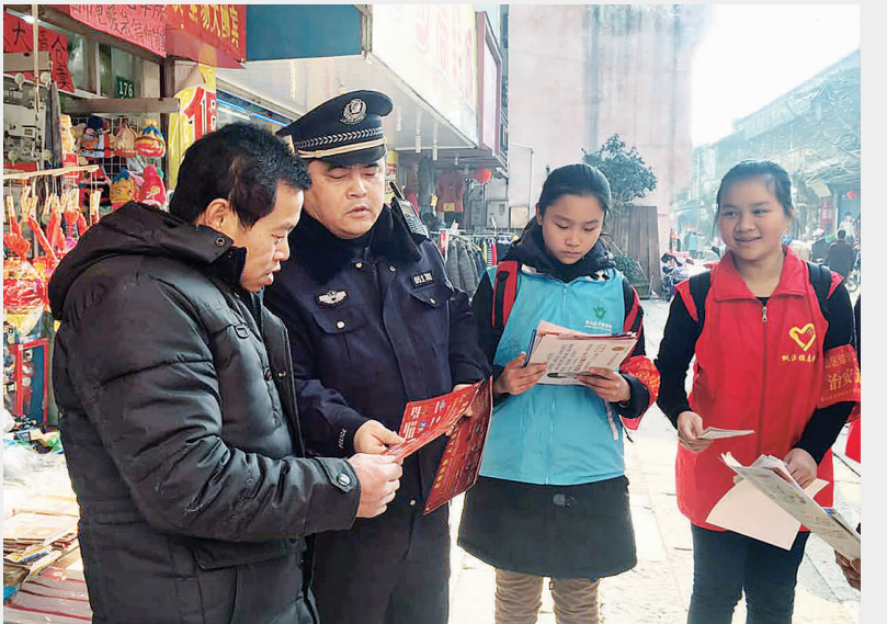
枫泾古镇的派出所民警与平安志愿者一同挨家挨户向沿街店家宣传上海烟花爆竹安全管控相关法律法规。

据透露,目前与思敦信息科技有限公司有合作意向的企业已有 6 家,一把低能耗的电子锁能否再次撬动共享单车的市场格局呢?道理似乎很简单,谁能为公众提供更好的骑行体验,谁就是最后赢家,这一次,还要由技术说话。