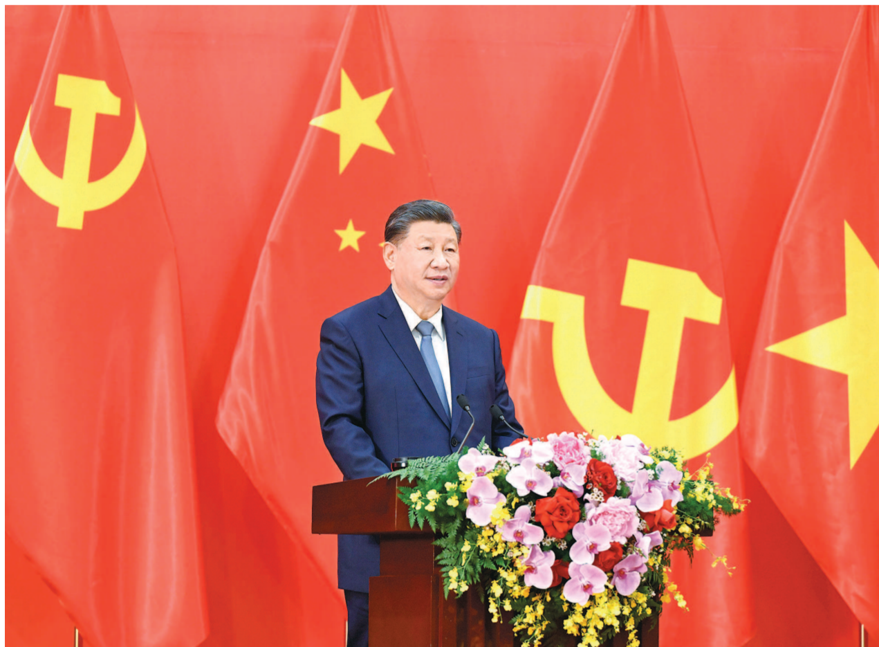
当地时间12月13日下午,中共中央总书记、国家主席习近平和夫人彭丽媛在河内同越共中央总书记阮富仲夫妇共同会见中越两国青年和友好人士代表。这是习近平发表题为《赓续传统友谊,开创中越命运共同体建设新征程》的重要讲话。

在结束对越南进行国事访问即将启程回国之际,习近平和夫人彭丽媛同阮富仲和夫人吴氏敏话别,还同武文赏举行会谈,强调携手推动具有战略意义的中越命运共同体落地生根开花结果 分别会见范明政、王庭惠