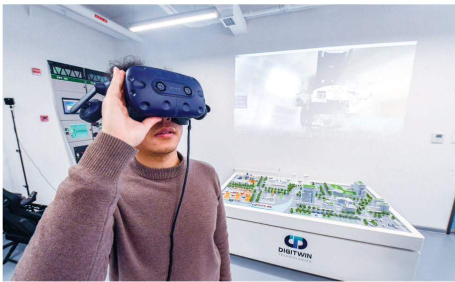
李数科技的工作人员使用VR眼镜进行展示。