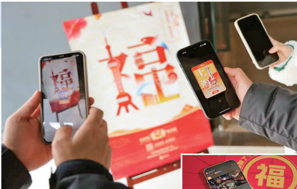
▲2023支付宝“集五福”活动推出上海限定的“定制福”,徐汇居民在家门口扫一扫就能获得。

与互联网零散自发的民众讲述不同,更值得鼓励和倡导的,是互联网平台主动承担民俗传承的使命——从最初的民俗营销,到参与构建民俗生活样态,再到助力民俗经济逐渐升温,推动着传统民俗迸发出新的活力。 春节民俗是传统民俗最为耀眼的时间,近年来不少新年俗持续涌现,如集五福、云拜年、抢红包、全家游就被票选为21世纪“新四大年俗”。可以说,依托于互联网技术与平台而生的新年俗,正重塑人们的过年方式,在传统与现代的融合中带来了新气象。 2022年《中国青年报》的一份调查就显示,69.6%的受访者会使用发微信、视频连线等方式,作为拜年的主要方式。对于云拜年,69%的受访者认为年味并不会变淡,而是会增强。