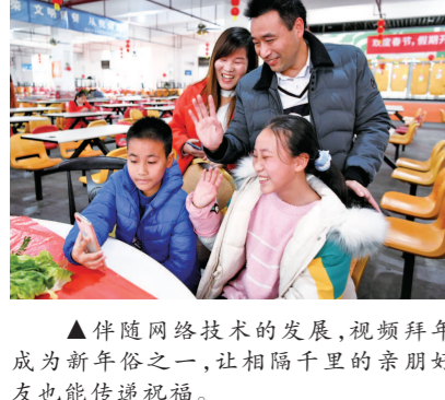
▲伴随网络技术的发展,视频拜年成为新年俗之一,让相隔千里的亲朋好友也能传递祝福。

同时,这些网络民俗并非无中生有,而是传统的延续,在网络世界以一种新的形式生存,其文化内涵还会变得更加坚实。 更值得注意的是,互联网平台已成为民俗经济的重要推手,能拉动文化产业发展,更好助力实体经济。 网购年货的新民俗,就极大带动了春节期间的公众消费。如2022年12月启动的天猫年货节,就推动年货、兔年拜年服饰等成为热门搜索词;2023年货节开始一周后,京东上“年货”作为热搜同比飙升226%，“烟花”的搜索量更是上涨248倍。 支付宝“集五福”活动,也成了平台助力商家经营的数字化工具。今年1月,众多商家机构参与的五福专场生活直播,总观看人次达到近14亿。如上海豫园商城借助AR技术,让慢直播也充满过年的气氛,单日最高有2400万人次观看,整个五福期间累计超8000万人次观看,大量用户在评论区祈福、换福卡,玩得亦乐乎。 求职平台“1号职场”通过生活直播,给用户发福卡并推荐工作岗位,单场观看人次也突破了2100万。据统计,今年的集五福,用户和商家参与规模均为历年最高,用户参与热度同比上涨近3成,参与的商家小程序数量也是去年的30倍。可见其经济效益同样可观,扎扎实实地推动了内需,帮助着经济的恢复。 种种案例都说明:民俗的文化价值,正在互联网平台的持续开放中,转化为巨大的商业价值,朝着服务实体经济的方向延伸。 网络时代成为新民俗构建认同、传承发展的良机。当然,这离不开互联网平台的责任担当,离不开亿万网民的倾情参与,离不开管理机构的有效引导和监督。网络科技与民俗经济是新民俗发生认同的两翼,而文化内涵及其实用功能是新民俗成长的灵魂。 变化的是民俗,不变的是浓浓年味;“变”的是更创新的表达方式及载体,“不变”的是传承千年的家国情怀。借助互联网技术与平台,年味更浓,民俗也能更好踏上新路——传承千年文化,凝聚国人共识,推动文化产业经济发展。 网络民俗已来,这是中国民俗的复兴,也是民俗文化发展的盛事。 (作者分别为华东师范大学教授、非物质文化遗产传承与应用研究中心主任,上海视觉艺术学院文化创意产业管理理学院副教授、民俗学博士后)