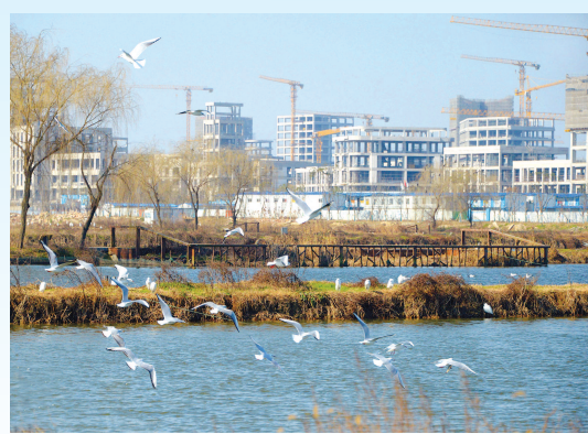
日前,在位于青浦区的华为研发中心建设工地河塘边,大批来沪迁徙越冬的红嘴鸥等野生候鸟正在栖息觅食。