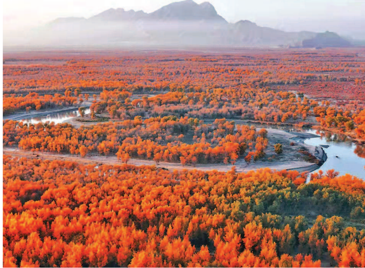
▲上海援疆挖掘巴楚胡杨资源发展乡村旅游。

巴楚所需，上海所能。上海援疆干部在巴楚三年间，从巴楚当地的核心优势和面临的关键问题出发，从最大效益发挥上海援疆优势出发，形成了当地乡村振兴的总体方向。规划已经落地，产业已经落地，借助上海城市软实力，巴楚必定能够实现全面发展和进步，让广大群众获得感、幸福感、安全感更加充实、更有保障、更可持续。