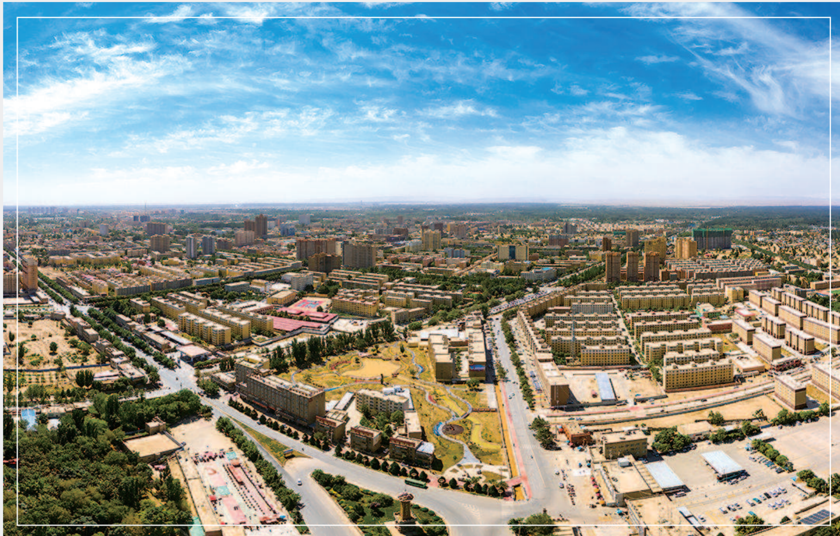
▲巨变中的昆仑第一城——叶城。

三年来，上海援疆叶城分指全体干部人才以产业发展为抓手，推动种植业、制造业、旅游业深度融合，在此基础上，整合资源整镇包联，为叶城县打造乡村振兴示范村、示范镇，带动当地群众就业增收，助力乡村振兴高质量发展。