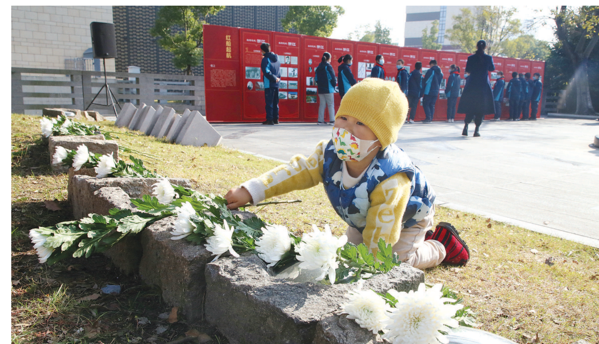
昨天是第九个南京大屠杀死难者国家公祭日，在上海淞沪抗战纪念馆，前来悼念的孩子为英烈送上鲜花。

2014年2月27日，十二届全国人大常委会第七次会议通过决定，以立法形式将12月13日设立为南京大屠杀死难者国家公祭日。