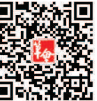
「文汇报笔会」 微信公众号

倘若老夫我额头撞大运，上门男孩能与我即谈书法艺术，讲献之书裙的典故，并阐述读书人之间礼仪相待，相亲相爱的话，那我就立即升级他为毛脚女婿。当然，前提是女儿不能有泄密意。这道我悉心准备的择婿考题。