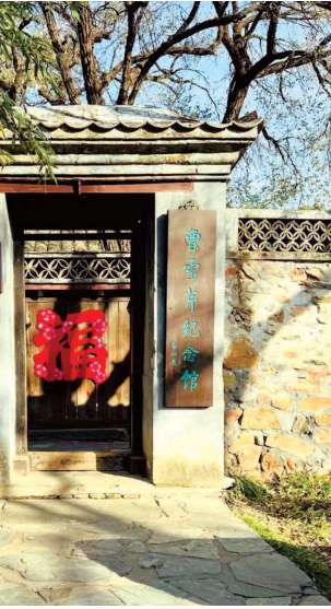
国家植物园北园内的曹雪芹纪念馆入口

女儿如期降生了，我们立即将她唤作“书裙”。谁知去派出所报户口的时候，几乎前功尽弃。户籍窗口那位警察阿姨，皱起眉头看了我递给她的小纸条，叹了口气说，这个名字不好，以后女孩要是动不动就在漂亮裙子上涂涂画画，多惹事啊。这样吧，我替你把“裙”字，改成女孩常用的“琴”吧。