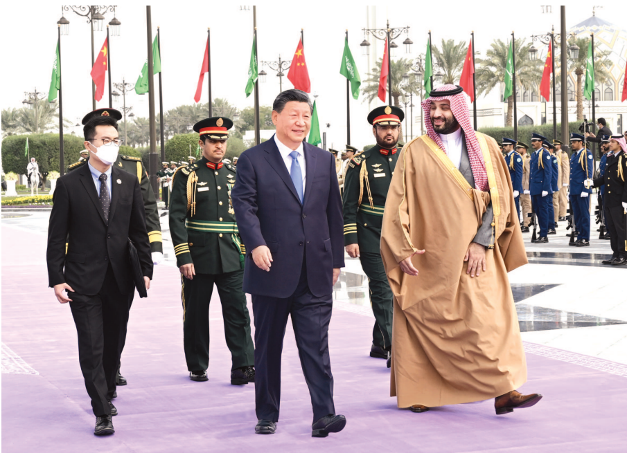
当地时间12月8日中午,沙特王储兼首相穆罕默德代表国王萨勒曼为正在沙特进行国事访问的国家主席习近平在利雅得王宫举行欢迎仪式。