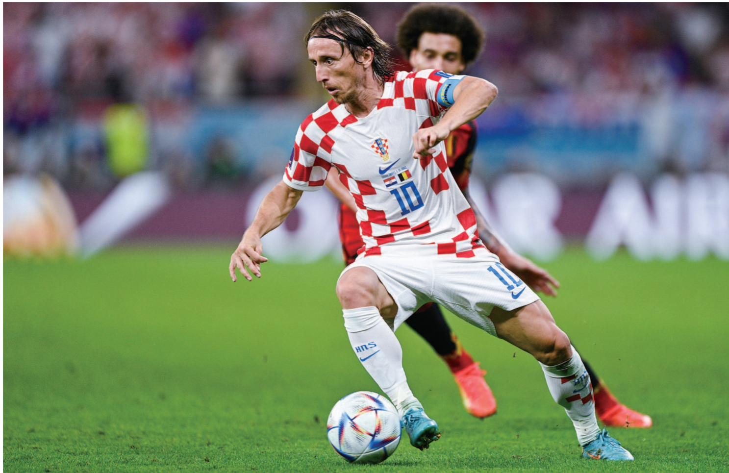
莫德里奇率领的克罗地亚队逼平对手，将比利时的“黄金一代”送出了世界杯。

德布劳内的表态曾引发队友不满，马丁内斯承认队内存在紧张关系。最后一战，比利时队暂时克服了队内矛盾，赛前队员们围成一团相互鼓气，场上也展现出求胜欲。但这不足以令他们战胜同样年轻的克罗地亚队。除了德布劳内与库卢图瓦，这将是比利时“黄金一代”的集体谢幕。上届世界杯的季军，成了他们最辉煌的记忆。1986年，希福、瑟勒芒斯领衔的比利时队闯入世界杯四强；32年后，“黄金一代”才得以更进一步。下一次辉煌，何年何月？