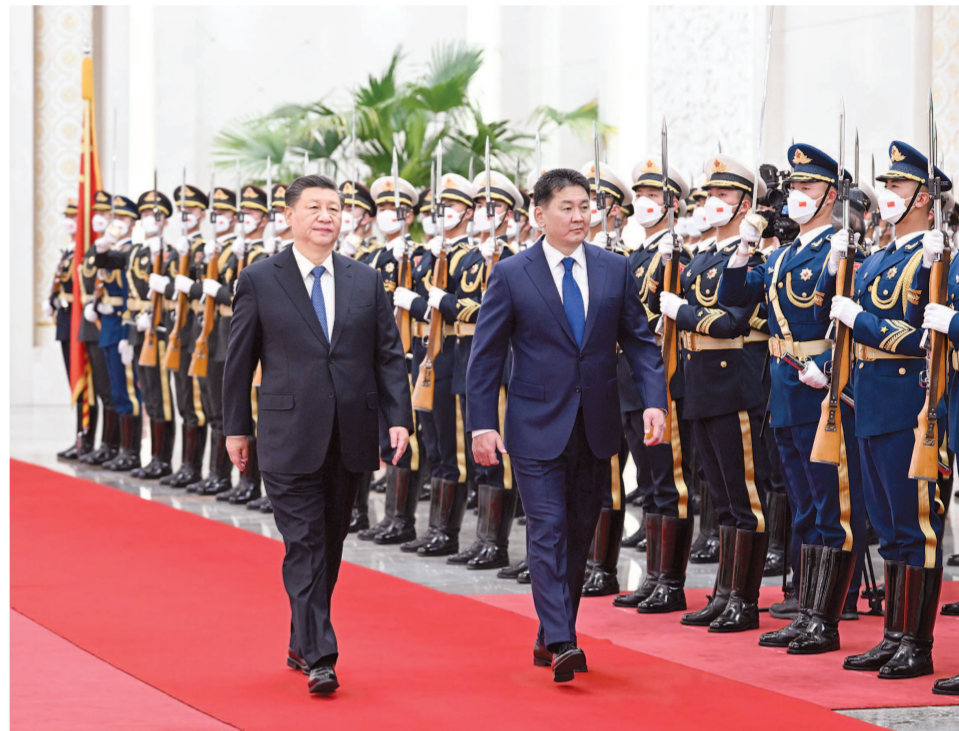
会谈前,习近平在人民大会堂北大厅为呼日勒苏赫举行欢迎仪式。