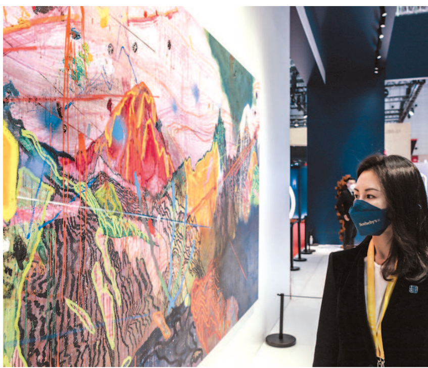
▲第五届进博会上,文物艺术品板块在相关政策的惠及下,吸引来自5个国家和地区的12家境外艺术机构82件展品参展,货值超过12亿元人民币,参展规模和品类再创新高。最终,37件展品达成购买意向,总成交额达4.9亿元人民币。图为第五届进博会文物艺术品板块现场