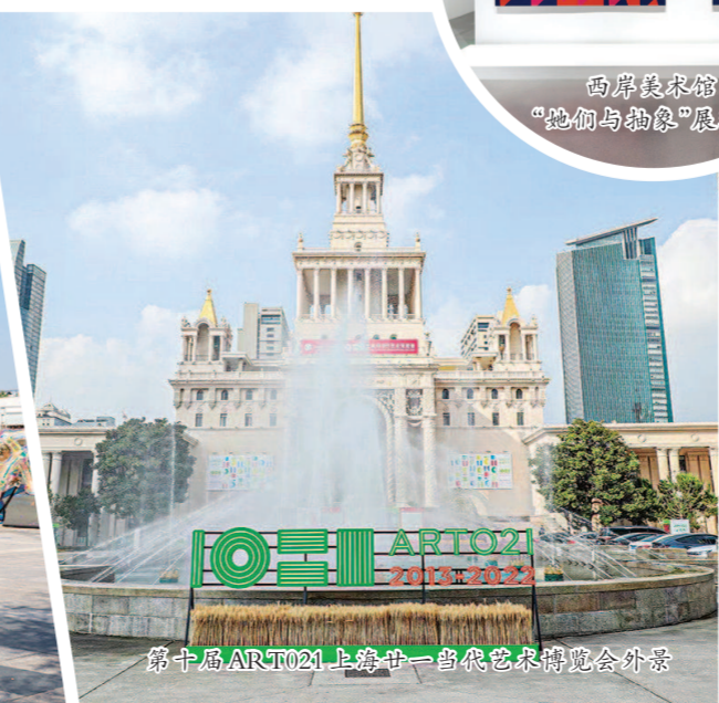
第十届ARTO21上海廿一当代艺术博览会外景