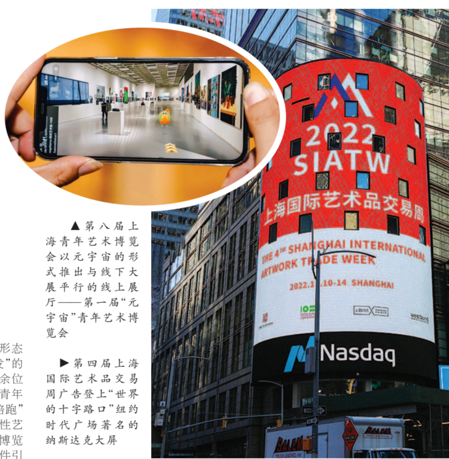
▲第八届上海青年艺术博览会以元宇宙的形式推出与线下大展平行的线上展厅——第一届“元宇宙”青年艺术博览会

可以说,围绕“政策集中、主体集中、交易集中、效益集中”总体策略,上海国际艺术品交易周已经成为国际文物艺术品交易重要一站。