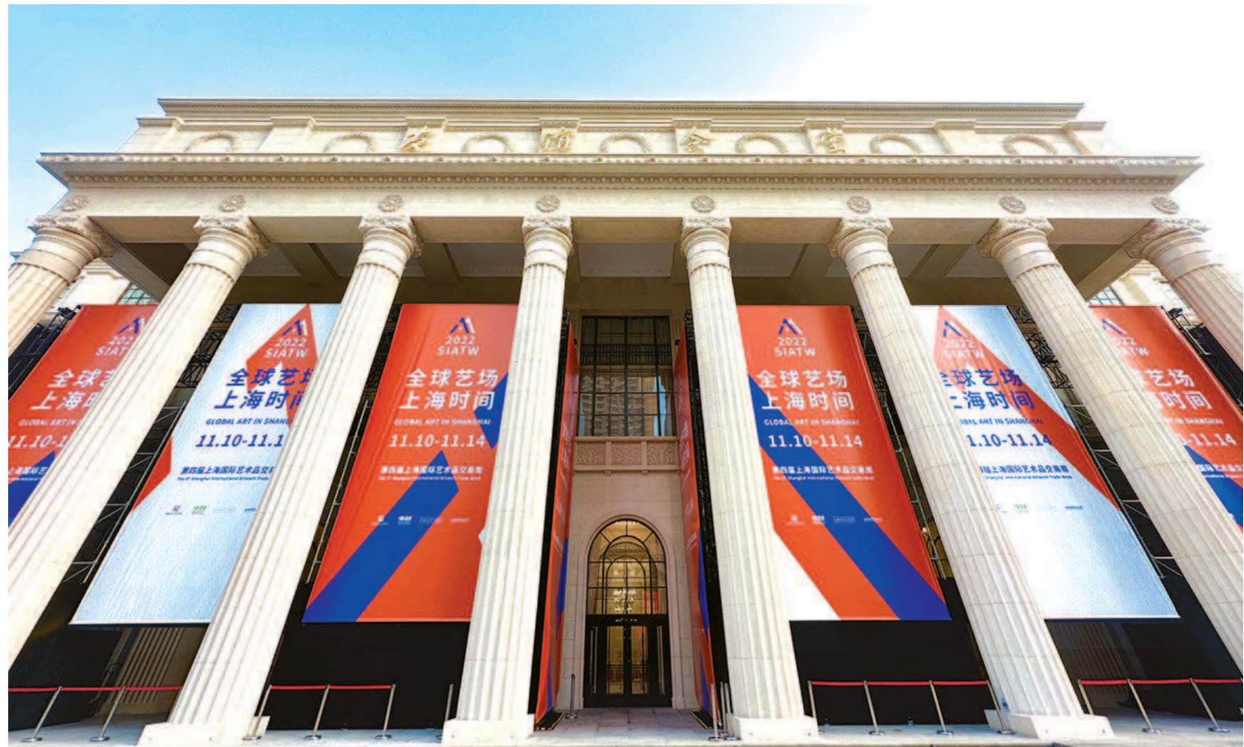
▶第四届上海国际艺术品交易周充分整合全球艺术资源,全程精品突出、亮点纷呈、热度持续、风险最低,打开全球艺术场的“上海时间”。图为本届交易周位于静安的主会场