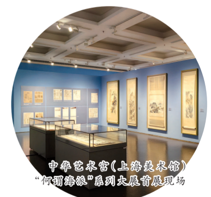
中华艺术宫(上海美术馆)“何尔根”系列大展首展现场

在徐汇的西岸区域,走过十周年的“西岸美术馆大道”联动各场馆推出近30场文化艺术活动。其中,龙美术馆的十周年馆庆特展——“存在于世”“多重景观”“南张北齐”,首次以“具象、抽象、古代”三大篇章,横贯古今、纵跨东西,晒出包括张大千、齐白石、保罗·高更、莫迪里阿尼、赵无极等艺术巨匠超300组史诗级巨作的丰厚“家底”,带领人们纵览跨越两百年的艺术发展史。西岸美术馆携手蓬皮杜中心推出国内首个聚焦女性抽象艺术家群体的专题展“她们与抽象”。展览甄选