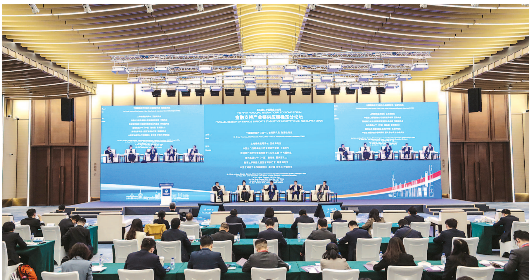
虹桥国际经济论坛“金融支持产业链供应链稳定”分论坛现场。

面对经济发展的不确定因素，上海将进一步增强产业链供应链的稳定性和韧性，努力掌握产业链核心环节，强化对核心企业以及金融机构的精准服务，鼓励金融机构、金融市场在有效管理风险的前提下，综合运用信贷、债券等各类新工具支持产业链供应链核心企业提高融资能力和流动性，同时，进一步加大对上下游企业，特别是中小微企业的综合性支持，鼓励金融机构创新金融科技，整合物流、资金流、信息流，打造一体化的金融产品和服务体系。