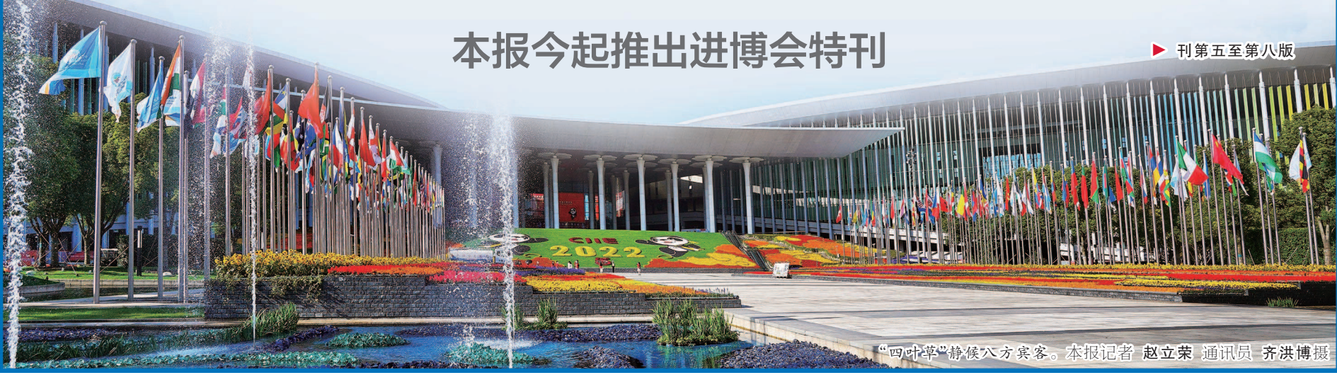
“四叶草”静候八方宾客。