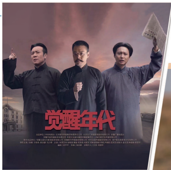
《觉醒年代》《山海情》等16部作品获颁“飞天奖”优秀电视剧奖。 制图:李洁