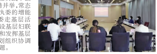
组织、引导下,成立了金融、法律、人才三大行业党建联盟,现已开展了46项行业特色活动。面对疫情影响,金融行业开展了“融资我来帮”项目,影响中小企业融资方案;法律行业推出了“法律易和堂”等项目,免费为企业和个人提供相关法律咨询;人力资源行业推出“职场加油站”项目,为企业共享员工、云招聘助力,为社区就业困难人员、大学生就业助力。

今后,金山区妇联将继续以“农”为媒,将组织建设各项工作串点成链,打造新时期妇女妇联组织建设基础的新蓝图。