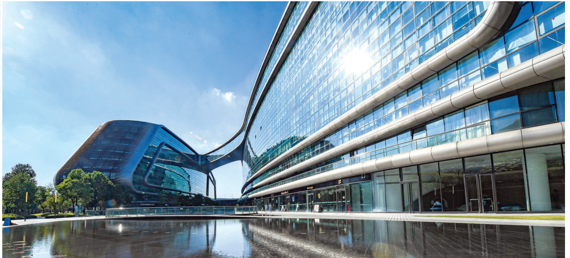
▲位于“大虹桥”核心区、紧邻虹桥交通枢纽的SKYBRIDGE HQ 天会(原名凌空SOHO)。

虹桥国际开放枢纽肩负着推动长三角一体化发展、服务构建新发展格局、增创国际合作竞争新优势等一系列战略使命。要深入学习贯彻习近平总书记关于推动长三角一体化发展的重要讲话和指示批示精神，按照中央决策部署，进一步凝聚共识、协同行动，加快推进落实《虹桥国际开放枢纽建设总体方案》，着力做强区域核心功能、推动政策制度创新、强化关键基础支撑，全力推动虹桥国际开放枢纽建设迈上新台阶，更好服务全国改革发展大局。