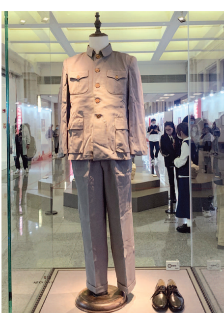
展览中,陈云穿过的一套中山装为首次公开展出。