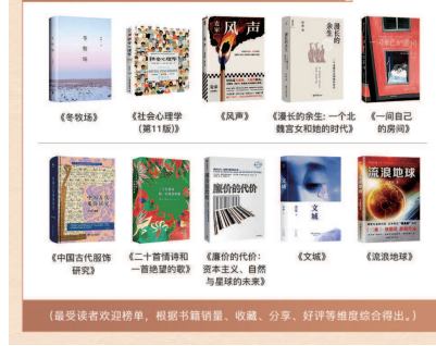
▲第四季“多多读书月”活动中最受读者欢迎的10本好书