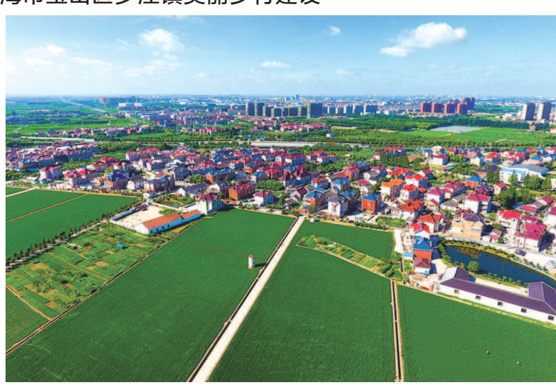
罗泾镇美丽乡村建设，通过“五村联动”推动产业兴旺，提升乡村治理水平。

罗泾镇地处上海市宝山区西北部，其独特的地理位置和丰富的自然资源，“米袋子”、“水源地”与“生态肺”自然成了这个镇的名词。 近年来，罗泾镇在宝山区委、区政府的坚强领导下，坚持生态立镇、发挥生态优势，把乡村作为超大城市的稀缺资源和城市核心功能的重要承载地，大力实施乡村振兴战略，致力于擦亮上海“北大门”，建设宝山“后花园”，打造极具罗泾特色的生态旅游小镇。经过不懈努力，罗泾镇先后获得全国特色小镇、国家卫生镇、中国最美村镇、上海市文明镇、上海市无违建“十佳”街镇、上海市平安示范社区等20余项国家、市级荣誉称号。 “五村联动”推动产业兴旺 产业振兴是乡村振兴的重中之重，要坚持精准发力，立足特色资源，关注市场需求，发展优势产业，促进一二三产业融合发展，更多更好惠及农村农民。 自乡村振兴战略实施以来，罗泾镇坚持基础建设、产业建设两不误。在“五村联动”落地后，依托良好的生态资源、空间布局和产业布局，持续强化三大特色产业，共建康养品牌、研学品牌、农旅融合品牌，做强生态底色，打造文化旅游线路，为乡村注入更多活力，为农民增收增收。 首先是产业推动“组团式”发展。罗泾镇以塘湾村母嬰产业为核心驱动，打造“慈孝育乡·母嬰康养村”；以海星村、花红村农业产业为核心驱动，打造“渔米之乡·渔耕休闲村”；以新陆村、洋桥村自然教育产业为核心驱动，打造“江海原乡·自然教育村”。五村连片组团发展，成功将产业规划优势、资源禀赋转化为经济优势、发展优势，让产业更兴旺，让农民更富裕。 其次是道路串联。罗泾镇用好已有的98公里人行步道，加快建设“四好农村路”，推动各村道路串联，以“一轴一环”打造一条主线长21公里的“泛彩骑行·休闲半马”旅游线路，串联五村产业、文化和生态节点，实现共同发展、共同富裕。 最后是水系联动。罗泾镇依托168条、145公里河道岸线，巩固河道治理成效，努力实现“水清、水净、水活、水美、水绿”的目标，有机整合水乡河道、老宅、老宅等资源，打造“美丽水乡·蓝色水系”，再现江南经典水系肌理，大力探索推进十里桃花水上游等水上休闲娱乐项目，不断丰富游憩体验。 “多元举措”提升治理模式 在推行多元治理提升乡村治理现代化水平的实践中，罗泾镇立足实际，为塘湾村、海星村、花红村、新陆村、洋桥村五村创造良好的联动条件，持续探索“五村联动”模式下的社会治理新模式，及时处置各类社会治理