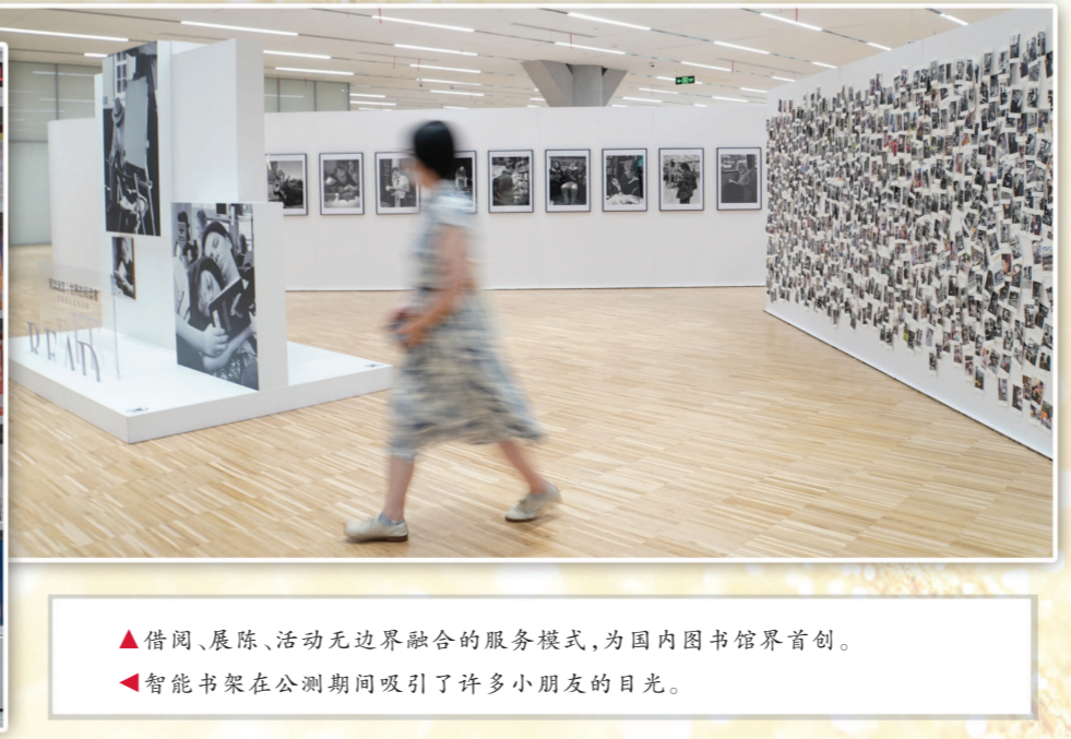
▲借阅、展陈、活动无边界融合的服务模式，为国内图书馆界首创。 ▲智能书架在公测期间吸引了许多小朋友的目光。