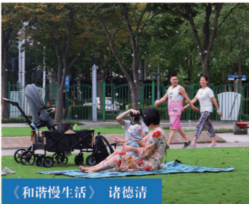
《和谐慢生活》诸德清