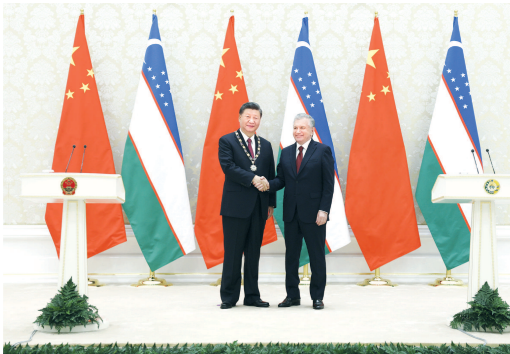
当地时间9月15日,国家主席习近平在撒马尔罕国际会议中心接受乌兹别克斯坦总统米尔济约耶夫授予“最高友谊”勋章。

本报撒马尔罕9月15日专电(特派记者赵忠奇)当地时间9月15日,国家主席习近平在撒马尔罕同乌兹别克斯坦总统米尔济约耶夫会谈。两国元首宣布,着眼中乌关系长远发展和两国人民未来福祉,双方将扩大互利合作,巩固友好和伙伴关系,在双边层面践行命运共同体。