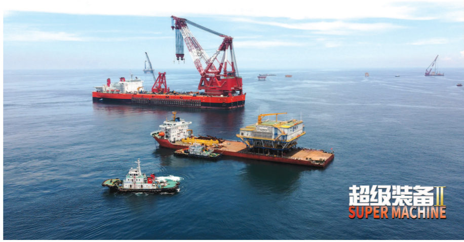
全球起重能力最大的起重船振华30号。