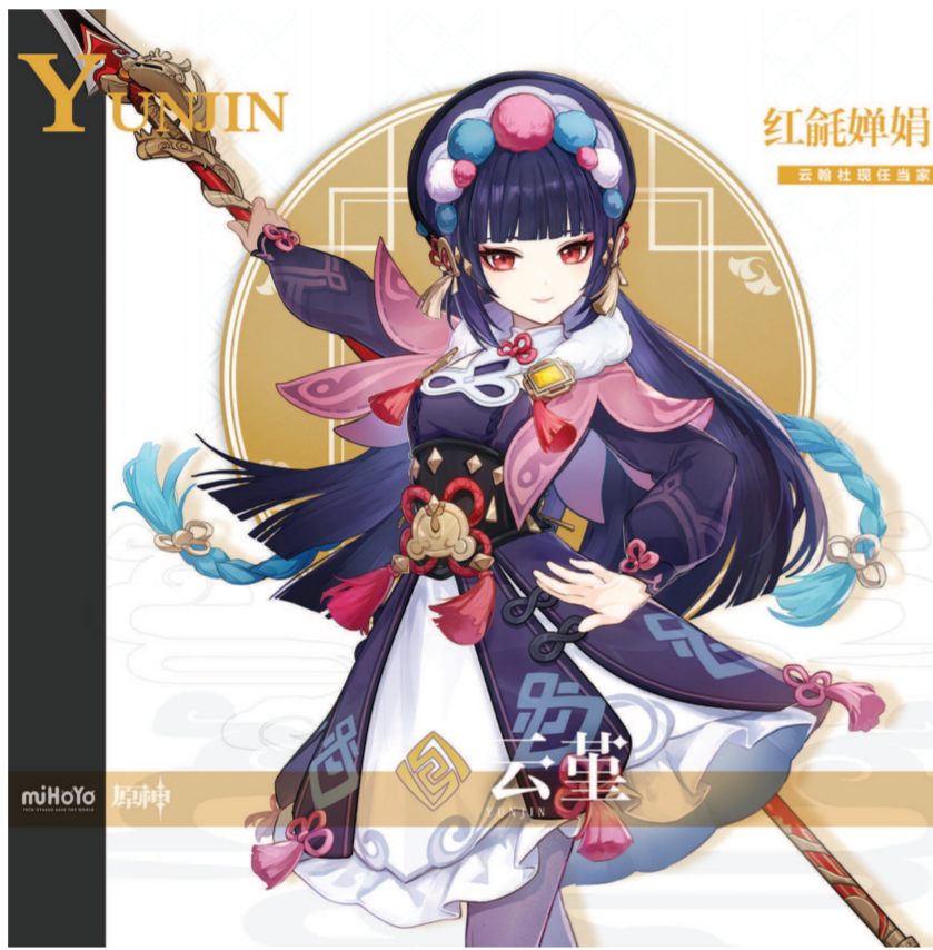
《原神》游戏角色云堇演绎《神女劈观》,让中国传统戏曲风靡网络。图为云堇海报。

《报告》显示,沪上游戏产业发展势头良好:上海自主研发网络游戏销售收入约占全国的30%,且近年保持稳定。在《万国觉醒》《原神》等成熟产品长线运营,以及《Warpath》等新产品持续发力的作用下,上海游戏产业海外市场发展较快,销售收入占比整体增长。在“2021—2022年度国家文化出口重点企业及重点项目名单”中,上海沐