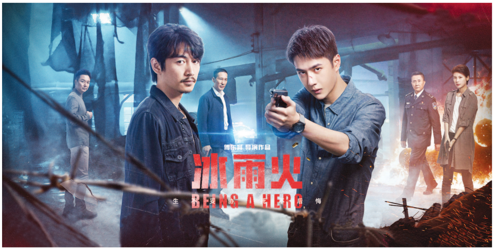
《冰雨火》中的案件来自现实中真实案例，主创团队力求以现实主义笔触，讴歌缉毒警察这一新时代英雄集体的风采。