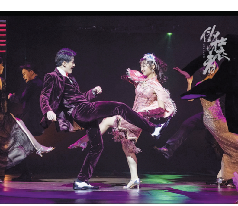
全新改版的音乐剧《伪装者2022》将于十月回归申城舞台，作品在保留初版强大主创、制作班底的同时，将新增“新剧情、新角色、新舞蹈、新音乐”四大亮点。

作为上海音乐剧艺术中心成立以来的首部大型原创作品，音乐剧《伪装者》展现出对于发展中国音乐剧产业的决心与思考。以上海作为孵化与演出的起点，持续创排开启了音乐剧艺术中心的自主创作之路。通过《伪装者》这一剧目，创作者用文化重塑城市性格，用内容丰富的舞台形式重现峥嵘岁月，延续海派文化的生命力，吸引更多观众走进剧场。剧中关于个人选择与成长的话题，也引发了年轻一代观众对于当下的思考与共鸣。这部经过市场检验的作品将以全新的面貌与观众在剧院相见，并将持续讲述上海故事，反映海派文化，传达青年精神。