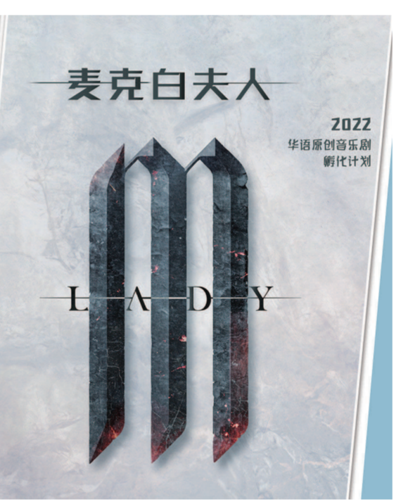
入围2022华语原创音乐剧孵化计划的部分作品海报。制图:李洁