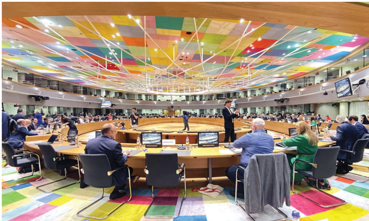
7月26日，欧盟27个成员国能源部长在布鲁塞尔召开特别会议，聚焦欧盟天然气短缺问题。

对于此次俄方再因“技术原因”送修涡轮机，德国政府表示不接受，认为俄方将削减天然气作为政治筹码。不过俄罗斯总统新闻秘书佩斯科夫25日表示，这一“技术原因”来源于西方