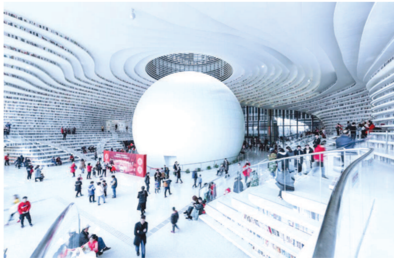
天津滨海图书馆 资料图片

今天，得益于新兴技术和开创性设计，图书馆再不仅仅是曾经那个安静的藏书圣地——先进的图书检索技术使得图书馆能够腾出更多空间，营造充满艺术气息的公共空间，这也使得越来越多的图书馆成为城市重要的“会客厅”。根据皮尤研究中心对美国图书馆访问率的分析，千禧一代比其他任何一代人都更多地使用图书馆。虽然历史学家认为17世纪才是“图书馆的黄金时代”，但以下这些充满未来感的设计和项目表明，图书馆的复兴已在悄然推进。