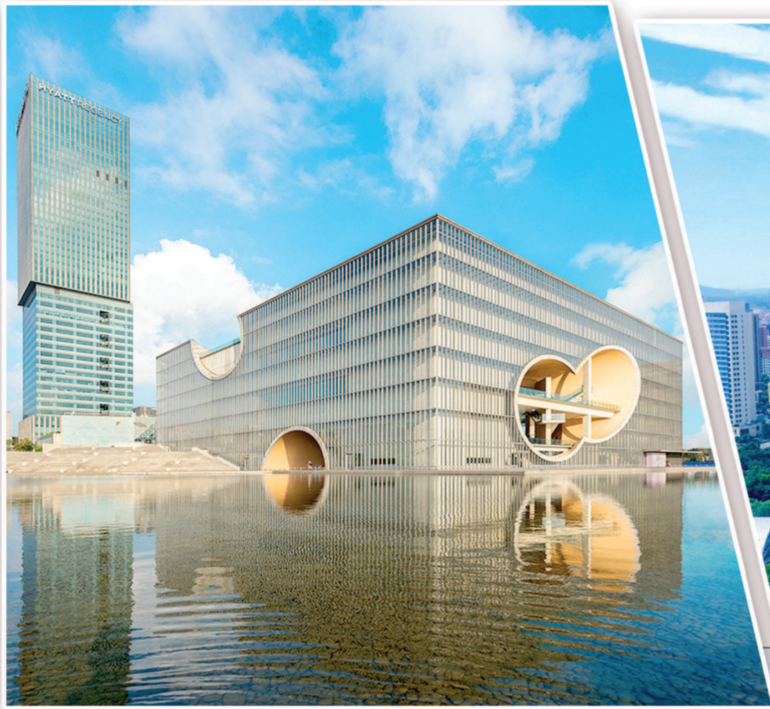
▲“五个新城”一批高起点高质量公共设施陆续建成投用,成为上海乃至长三角的“网红”打卡地。图为嘉定新城保利剧院。 ▶聚集“五型经济”及“产城融合”的新产业布局,“五个新城”将提升产业发展能级。图为青浦工业园区。