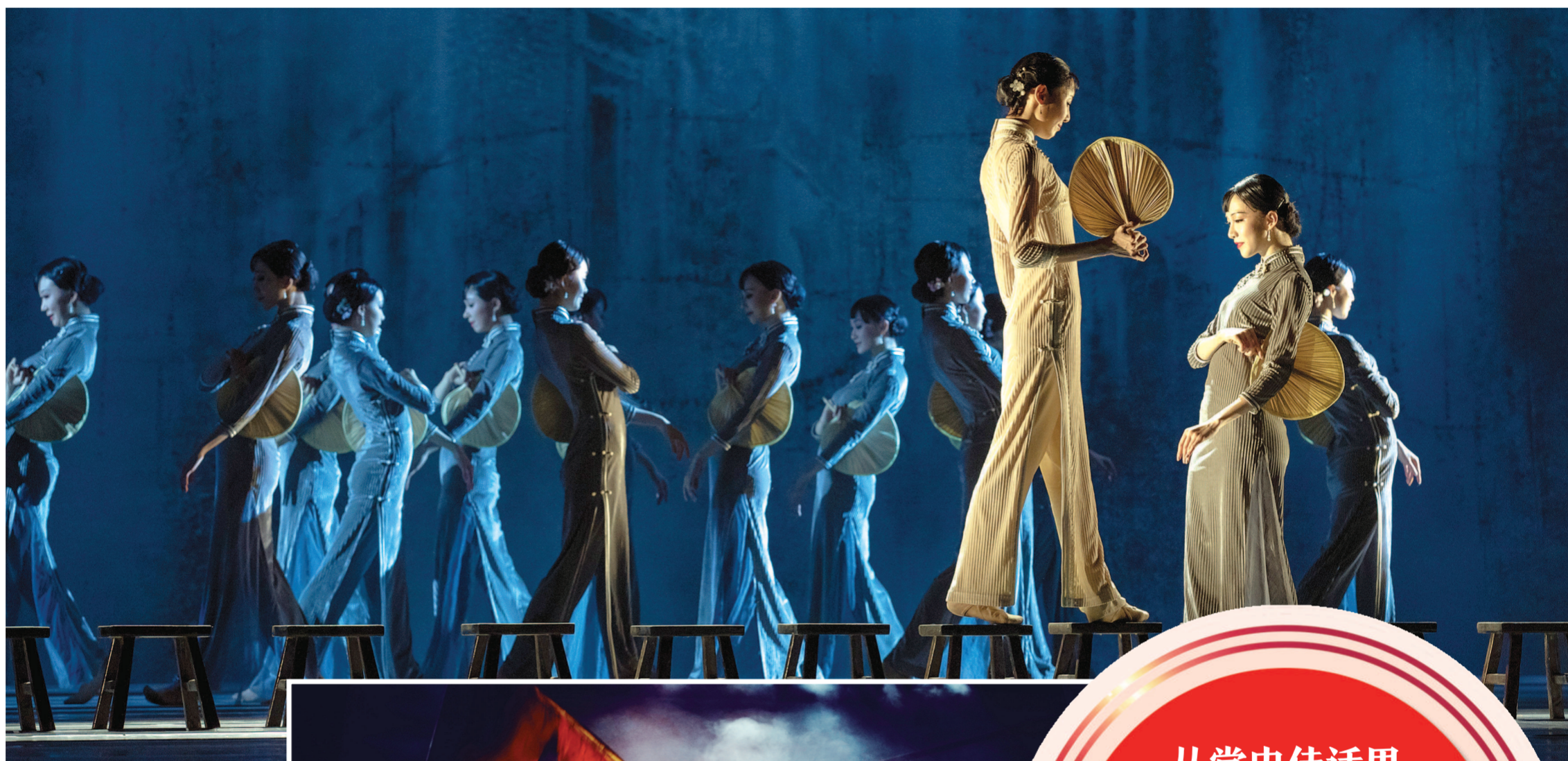
▲舞剧《永不消逝的电波》剧照。 ▶杂技剧《战上海》剧照。

2022年伊始,电影《1921》在北京和上海两地的长期固定放映开始了。去新天地和中影党史馆影院观看这部建党题材大制作、聆听伟大建党精神叩响的第一记时代强音,被许多人写在自己的红色日志上。