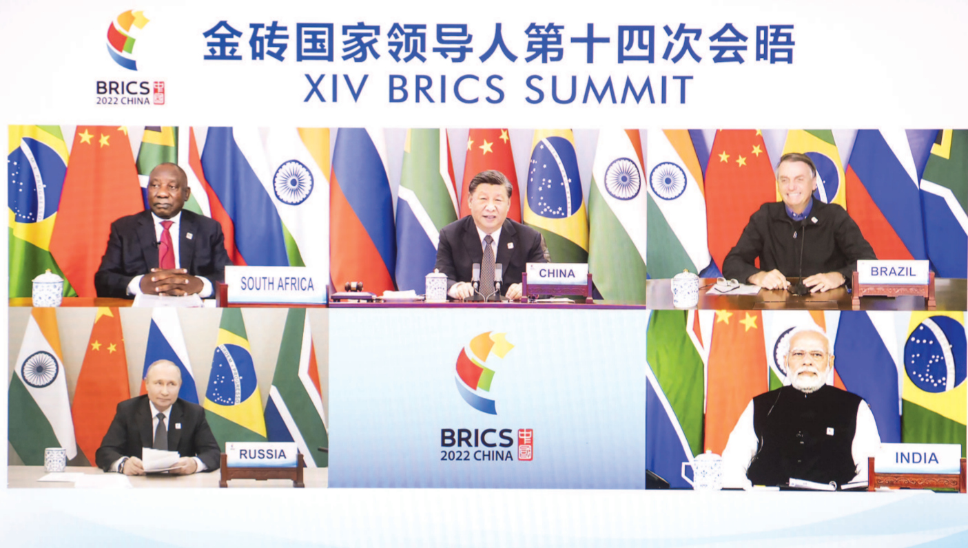
6月23日晚，国家主席习近平在北京以视频方式主持金砖国家领导人第十四次会晤并发表题为《构建高质量伙伴关系 开启金砖合作新征程》的重要讲话。南非总统拉马福萨、巴西总统博索纳罗、俄罗斯总统普京、印度总理莫迪出席。