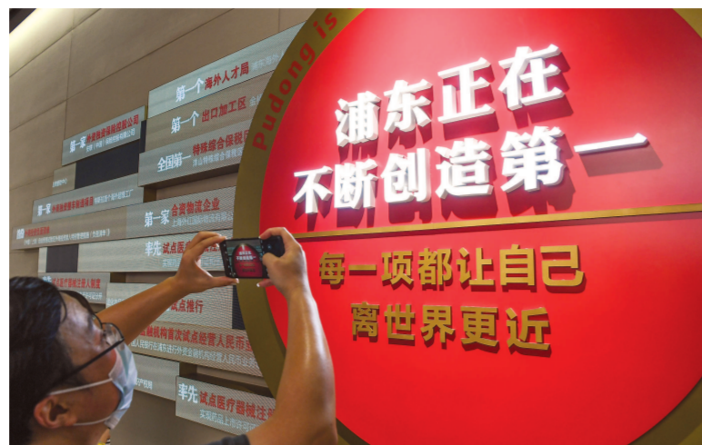
浦东新区干部群众把浦东开发开放30周年主题展览打造成为学习国家战略引领区高水平改革开放的重要阵地...