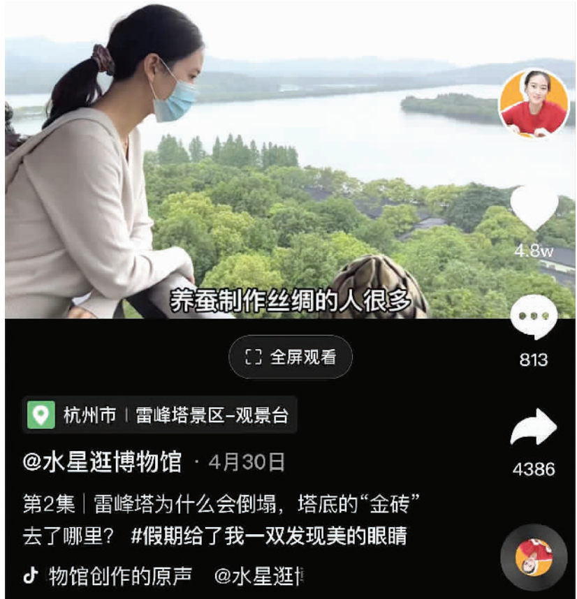
“水星逛博物馆”发布的视频截图。

身为浙江大学考古学博士的博主“水星逛博物馆”在逛博物馆的时候目睹了一位家长给孩子错误的讲解后，