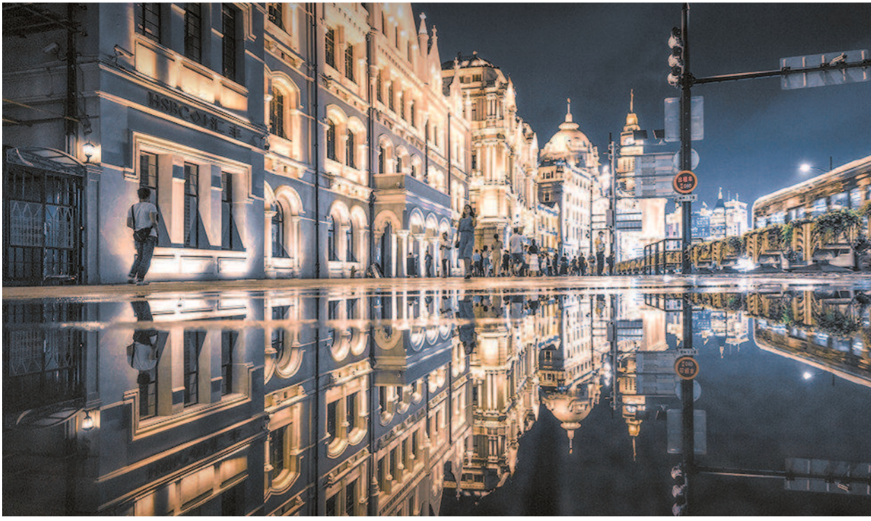
▲上海外滩美景。(本版图片除资料图外,均来自视觉中国)